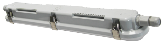
Rückansicht (Beispielhaft für die Serie)

Alle technischen Parameter gelten für die ganze Lampe / Leuchte. Aufgrund des komplexen Herstellungsprozesses von Leuchtdioden stellen die angegebenen typischen Werte der technischen LED-Parameter nur rein statistische Größen dar, die nicht notwendigerweise den tatsächlichen technischen Parametern jedes einzelnen Produkts, das vom typischen Wert abweichen kann, entsprechen.