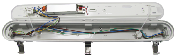
Innenansicht (Beispielhaft für die Serie)