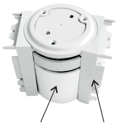
89-1053 + 89-1054 Flexibler Verbindungsblock + Verbindungsstücke